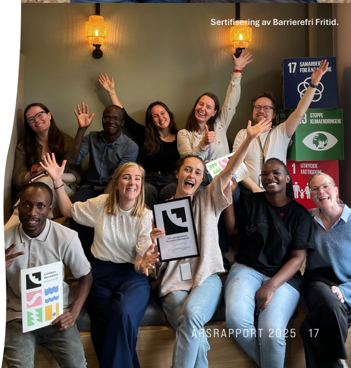
Sertifisering av Barrierefri Fritid.