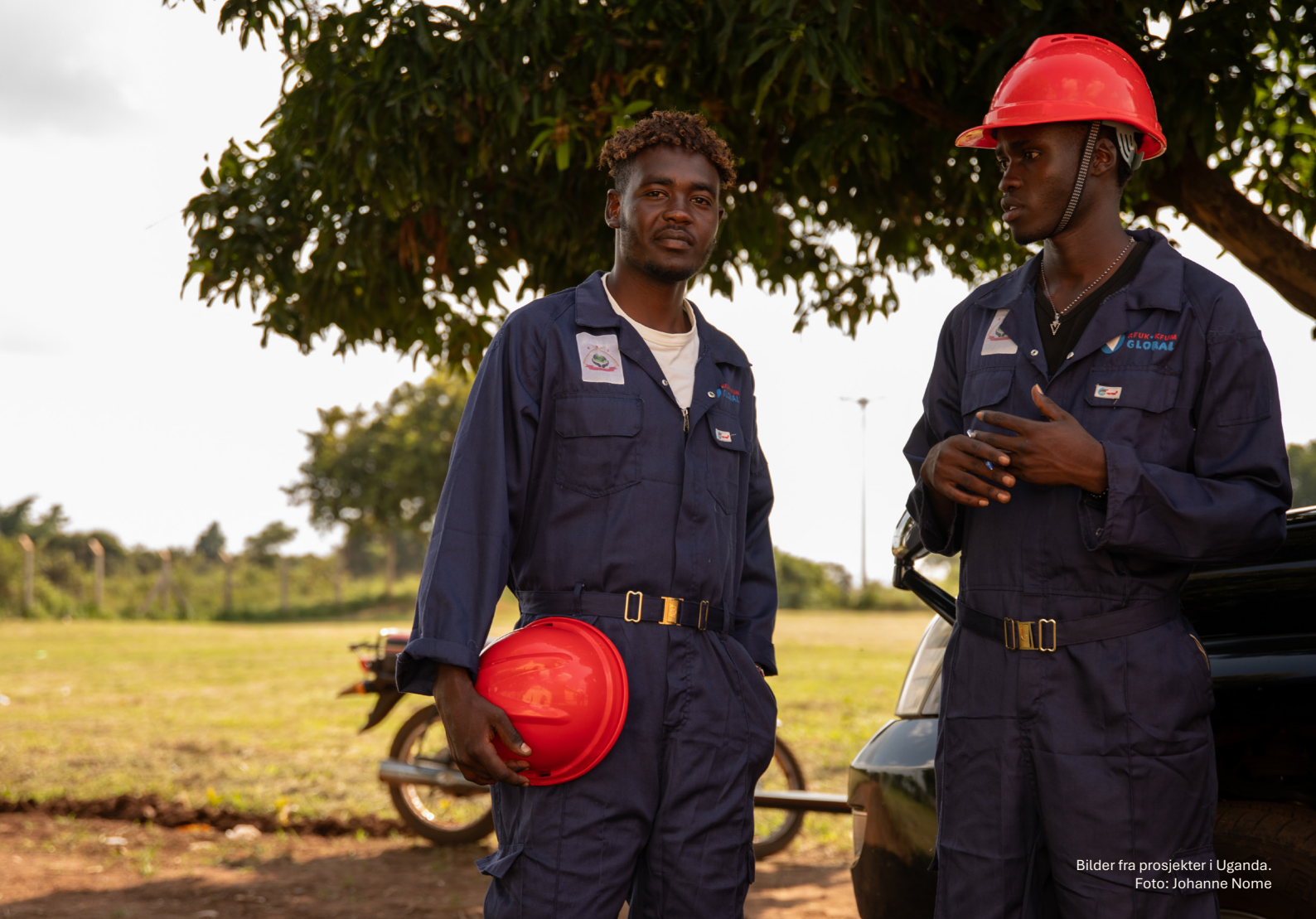
Bilder fra prosjekter i Uganda.