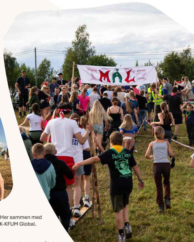
Målstreken under første Globalløp på leir.